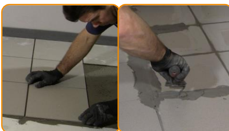
Posare la pavimentazione in ceramica o legno