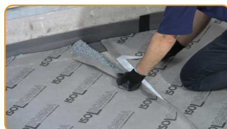
Incollare la cimosa adesiva aiutandosi con le linee di sormonto