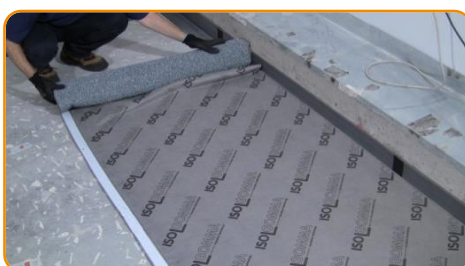
Stendere l'isolante acustico con i granuli di gomma rivolti verso il basso