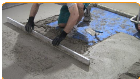
Realizzare il massetto