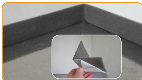
Incollare la striscia adesiva alla parete e al solaio realizzando gli angoli con cura