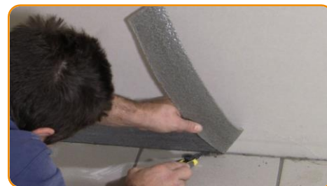
Tagliare la parte eccedente della striscia alla parete